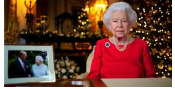
英女王聖誕文告賞析