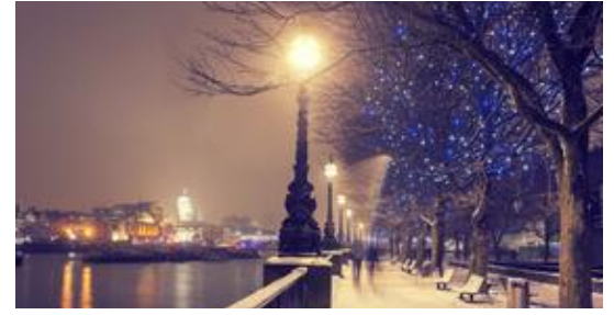
倫敦·香港·你的微笑